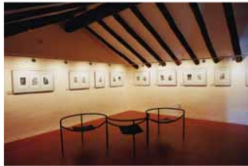
Musée de la gravure. Fuendetodos

La salle d'expositions Ignacio Zuloaga vient compléter la visite. Cet espace sert à la célébration de nombreux événements, de stages et de séminaires destinés aux