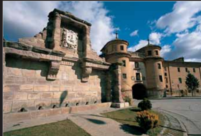
Porte de Terrer, Calatayud