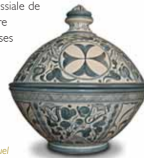
Céramique de Muel

Certaines études avancent que les peintures de l'église paroissiale de Remolinos pourraient être attribuables à Goya ou à ses disciples ; ces œuvres possèdent d'une façon générale une plus grande luminosité et des couleurs plus intenses.