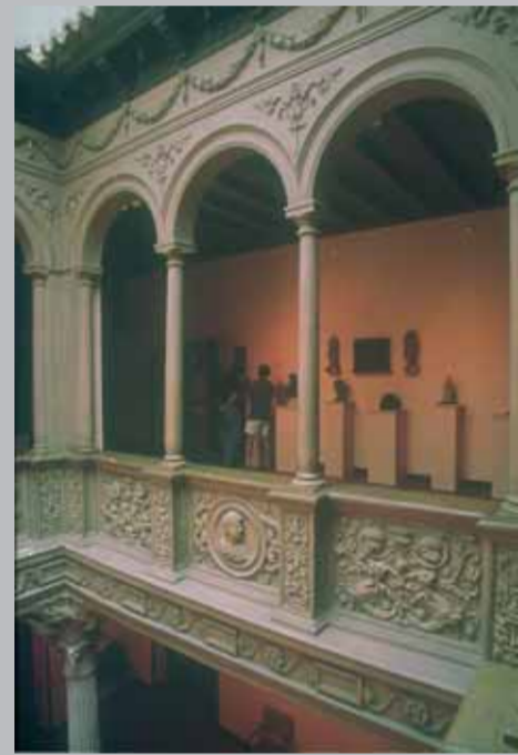
Camón Aznar musée

La deuxième moitié du 18ème siècle est marquée par d'importantes réformes nourries par l'esprit des « Lumières ». Au début du 19ème, l'Espagne vit une situation de crise généralisée qui sera aggravée par la