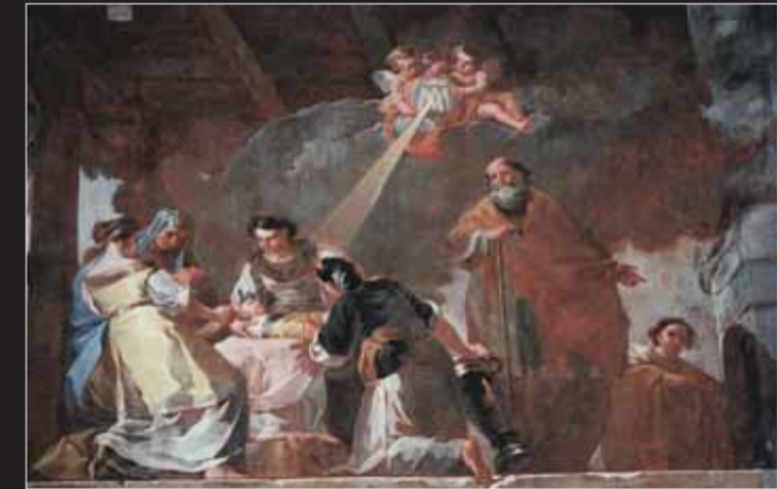
Chartreuse de l'Aula Dei