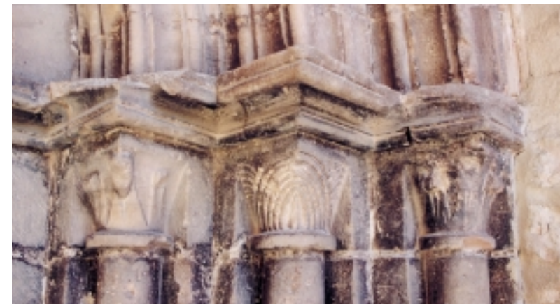
(arriba) Capiteles de la iglesia parroquial de Calcena

pervivieron en el subconsciente colectivo