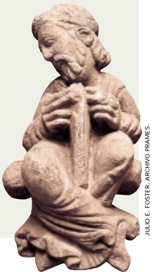
JULIO E. FOSTER. ARCHIVO PRAMES