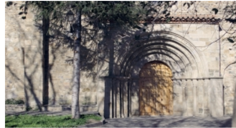
(arriba) Iglesia de Nuestra Señora de la Asunción. Añón

La iglesia del antiguo despoblado de Cabañas, junto a La Almunia de Doña Godina, sería el ejemplo de aquellos edificios religiosos que fueron patrocinados por nobles o señores, lo que explicaría la calidad artística de los elementos que la componen.