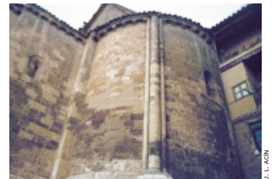
J. L. ACÍN

También en Daroca, se conserva la iglesia de San Miguel, de tres naves, siendo la central más ancha que las laterales, y con un ábside semicircular muy destacado. Al exterior puede comprobarse su buena fábrica de sillar, y la variedad de elementos decorativos que presenta. Destaca, aunque muy modificada por el tiempo, la portada, con cinco arquivoltas que apean en columnas adosadas a las esquinas, con motivos de dientes de sierra y ajedrezado. Los capiteles también recibieron decoración figurada, y en el frontón aparecería la escena de Cristo en majestad con el Tetramorfos. No olvidar tampoco las iglesias de San Juan de la Cuesta y Santo Domingo.