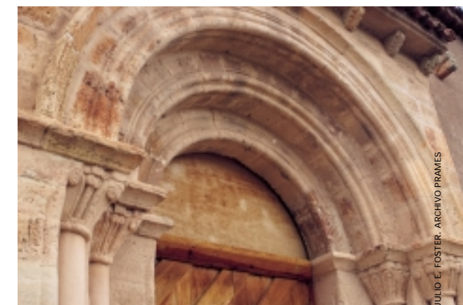
(abajo) Vista de la ermita y detalle de la portada de San Nicolás de Bari, en Azuara

En los territorios de Daroca es importante recordar la existencia de la ermita de la Virgen del Buen Acuerdo, junto a la laguna de Gallocanta, o la iglesia parroquial de la cercana localidad de Blancas, donde se conserva el ábside románico, que posteriormente fue recredido en altura.