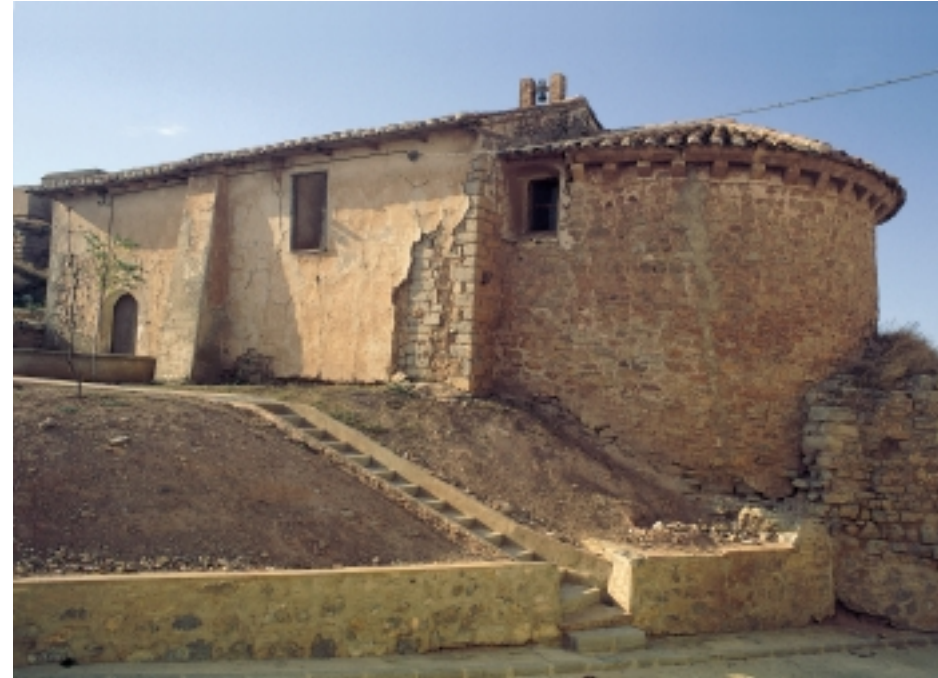
(arriba) Ermita de la Virtgen del Consuelo en Camañas