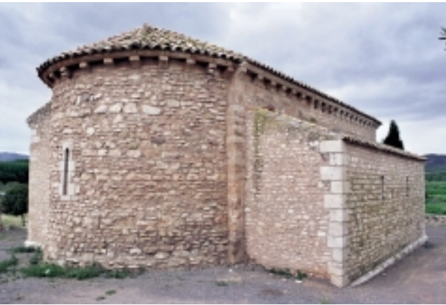
(izquierda) Ábside de la iglesia de Cabañas (abajo y derecha) Portada y capiteles en el castillo de Alcañiz